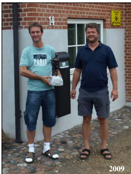
Foreningerne i Skjød