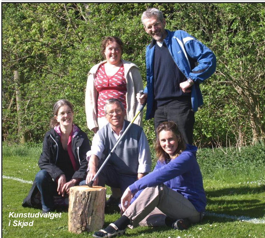
Kunstudvalget i Skjød

I dette nummer af Skjød Tidende kan du bl.a. læse om: