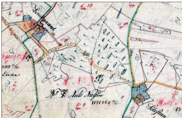
Lindgårde matrikelkort, 1800-tallet. Bemærk hedeområdet mellem Lindgård og skoven.