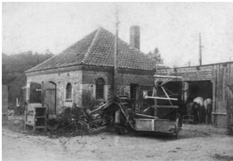
Skjød smedie. I portåbningen til højre kan man ane, at smeden er ved at sko en hest.

ligeholdelsen af deres materiel, men derudover havde han et væld af opgaver, at varetage i landsbyen. Han skoede hestene, lavede landbrugsmaskinerne, smedede ringene til dritlerne (tønderne), lavede søm og bolte og så var bysmedjen det sted hvor godtfolk mødtes. I varmen fra essen kunne man udveksle "oplysninger" om livet i landsbyen og træffe beslutninger om hjælp til hinanden med markarbejdet.