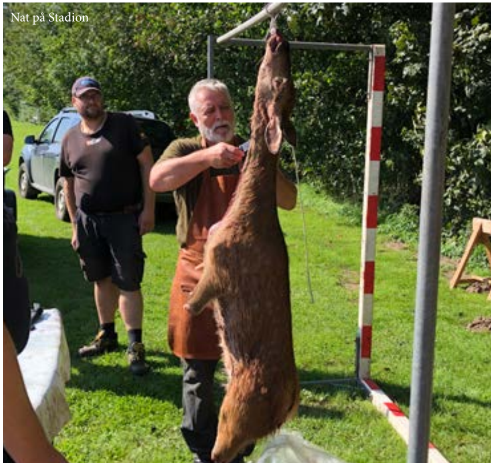
Nat på Stadion