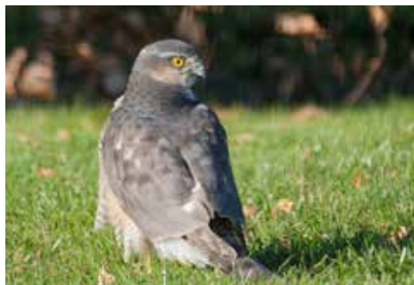
Spurvehøg, Mette Sig