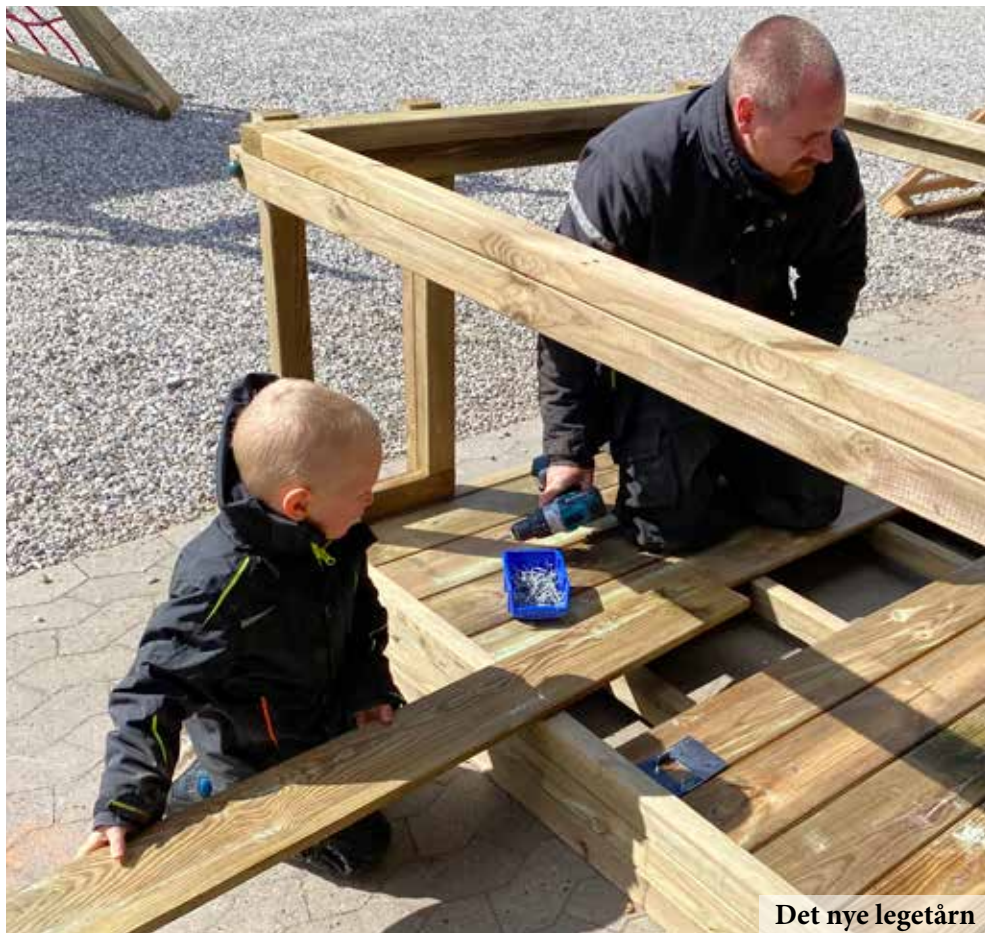
Det nye legetårn