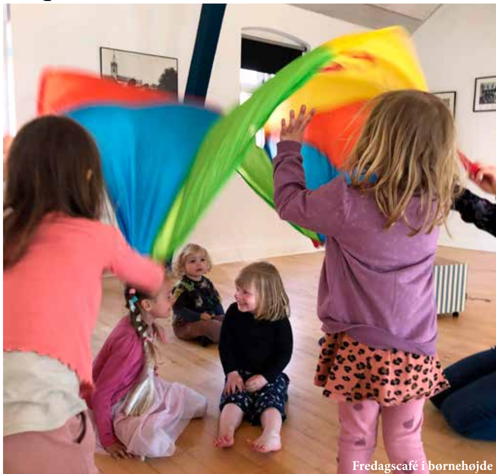
Fredagscafé i børnehøjde