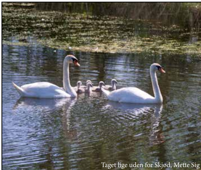
Taget lige uden for Skjød, Mette Sig